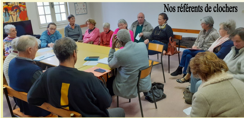
Nos référents de clochers

Le mardi 27 février au presbytère de Coutras se sont réunis tous ceux et celles qui veillent sur nos 18 clochers.