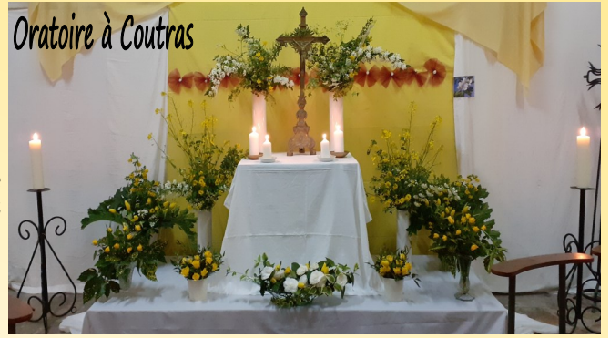
Oratoire à Coutras

Ne laissons pas le monde et les événements dévaloriser cet Amour. Gardons notre ceinture autour des reins pour mieux revêtir la tenue de service. L'oratoire avait ouvert ses portes pour réjouir notre regard et parfumer ce temps passé auprès de Jésus.