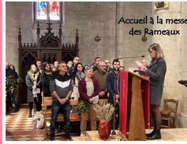
Accueil à la messe des Rameaux

disent certains. Les temps de réflexions entre futurs époux, entre futures épouses, entre couples se vivent avec une certaine fraternité animée de légèreté et de sérieux aux moments opportuns. Le presbytère de St Denis de Pile, le réfectoire de l'Ecole Notre Dame ouvrent leurs portes à ce groupe de futurs témoins du Christ. Un chemin se dessine et se fortifiera au cours de leur union. La communauté paroissiale fut