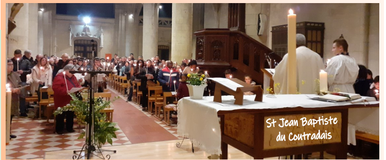
St Jean Baptiste du Coutradais

En nous relevant d'une chute nous mesurons la valeur de la liberté et de l'autonomie. Dieu nous montre son amour qui surpasse tout. Vivons dans cette ambiance qu'Il nous offre pour ressentir l'effet de son amour jusqu'au moment où nous serons près de Lui.