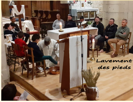
Lavement des pieds

Jeudi 28 mars LA CENE : fête de l'Amour du Christ, de l'Amour de Dieu pour le monde.